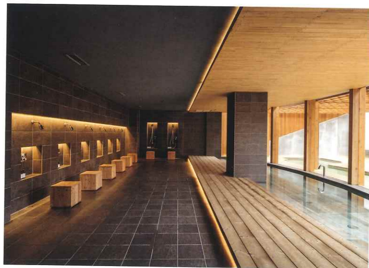
上左／1階男子更衣室の中央に計画された手洗いスペースと、同じ全長でつくられたベンチ 上右／1階ロッカールーム。一見してロッカーと分からないよう、木をルーバー状に貼り、番号とキーだけのミニマルなデザインとした。右奥に見えるのは、前室の壁面に直接描かれたアートペインティング 下／同階男子浴室。施設全体の素材感と合うよう、木の風呂イスと木デッキを新設した。また、シャンプー類やカラシが目立たないようにニッチを設け、間接照明を施している