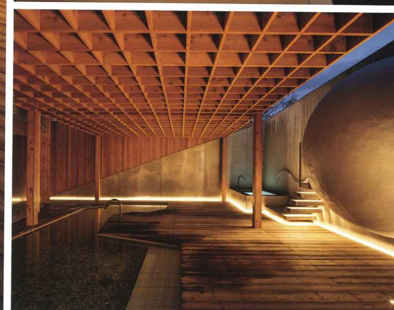
左/格子の日除けとデッキを設けた1階男子露天風呂は、ナトリウム塩化物泉の天然温泉。奥には、間接照明に照らされた水風呂や球体状のサウナ、ロウリュウサウナなどが見える 右上/球体状のサウナは、「ととのえ親方」ことプロサウナーの松尾氏(TTNE)が監修し、久保都島建築設計事務所がデザインした。一人で瞑想ができる個室タイプとなっている 右下/男子露天風呂を女子露天風呂側から見る。奥の壁面は、サウナ側に施されたモルタル調左官仕上げと格子を中心とした木の仕上げによって斜めに分節されている