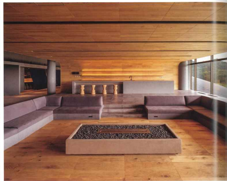
上/2階ダイニングレストラン。落ち着いて食事ができるよう、半個室をイメージさせるボックス型シートとした。天井は既存建築の特徴である三次元曲面の広がりを活かし、開放的な雰囲気を感じさせることを意図した 下左/2階会員専用のプライベートリビングに設置されたキッチンカウンター。会員が食材を持ち込み、料理を振る舞うことをイメージした 下右/プライベートリビングの中央には、バイオエタノールの暖炉を設置。ゴルフコンペ後のパーティーなどにも対応する