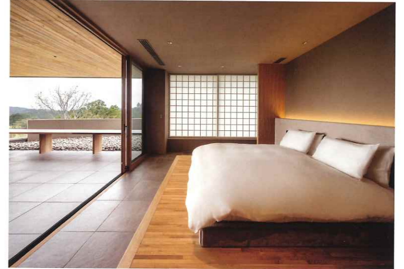
上/2階VIPルーム。テラスの開口部沿いにベンチ席を設けており、グリーンを見渡すことができる 下/VIPルームの寝室。ガラス張りの引き戸を開け放つことで、テラスと一体化した開放的な空間となる